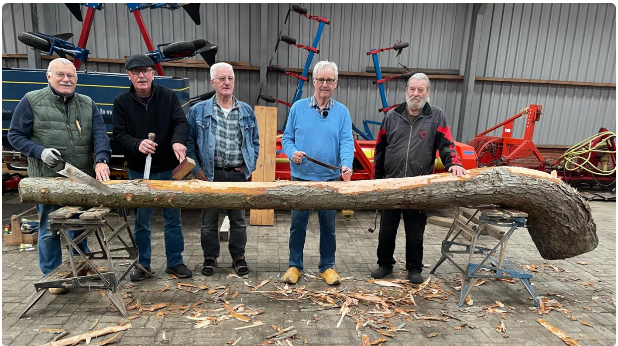
De Giezelbaargbloazers uit Veele

De Giezelbaargbloazers uit Veele hopen deze winter te kunnen blazen op de grootste midwinterhoorn die ooit gebouwd is. Ze hopen er een nieuw record mee te vestigen.